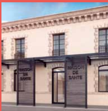
Façade arrière (photo non contractuelle)

L'enveloppe extérieure du bâtiment sera entièrement ravalée et unifiée par un badigeon au lait de chaux. La façade côté rue conservera son authenticité : les menuiseries bois seront légèrement simplifiées et le parvis d'entrée entièrement restauré à l'identique avec escalier de pierre et grande porte en bois à double vantaux. Le traitement de la façade arrière sera plus moderne avec menuiseries et pergola en alu sombre.