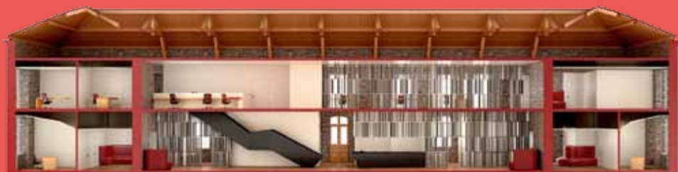
Perspective intérieure - Coupe longitudinale (photo non contractuelle)

L'intérieur sera entièrement redessiné pour en faire un lieu baigné de lumière naturelle.